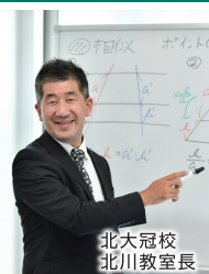
北大冠校 北川教室長

筑波ゼミナールは、生徒も先生も、みんなが笑顔になれる塾を目指しています。成績を上げるためには知識だけではなく、どんな気持ちで勉強に向き合うかが大切だと考えています。 楽しく通える環境だからこそ、学ぶ意欲が続きます。笑顔あふれる筑波ゼミナールで、一緒に頑張りましょう!