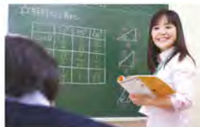
鯛先生 筑波ゼミ20年以上の指導歴で、解りやすい授業が好評です。また、高校生進路指導も担当。